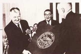
ストックトン市との姉妹都市提携