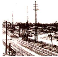
焼け野原になった清水市街