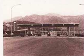
東名高速道路のインターチェンジ