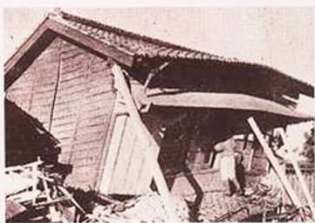
大谷地震で被災した民家