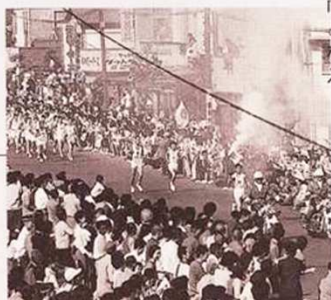
東京オリンピックの聖火リレー